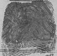
Right Index Fingerprint

Impressions forwarded to Headquarters P.I.B. by S. Kedkin Rank Cpl. Date 18/5-1944